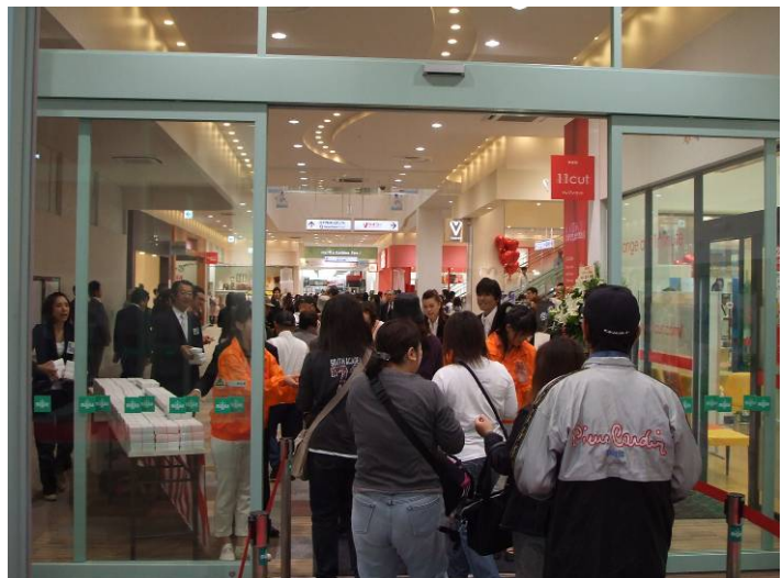
Part. 2 の賑わいの様子