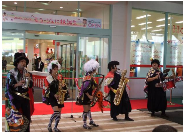
オープニングイベントの様子