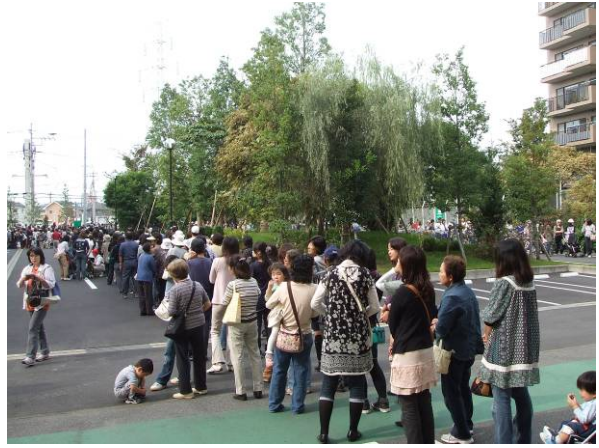
オープンをお待ち頂くお客さまの様子